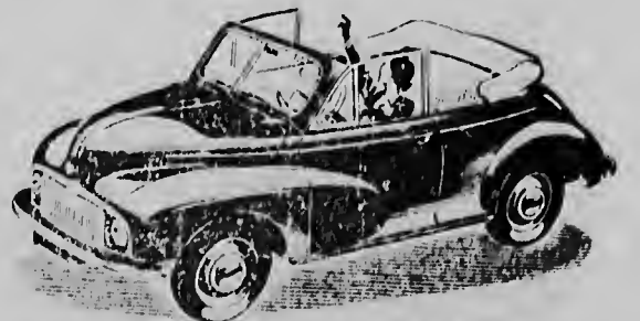
Morris Minor Cabriolet

Vraag ons de grootste kleine auto voor U te demonstreren